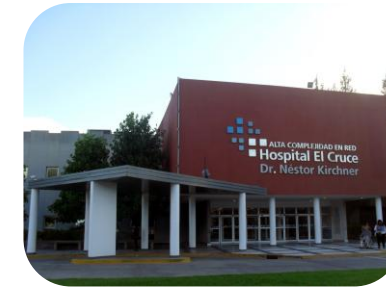
Hospital el Cruce