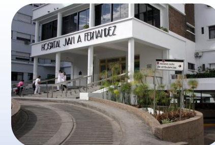
Hospital Juan A. Fernández