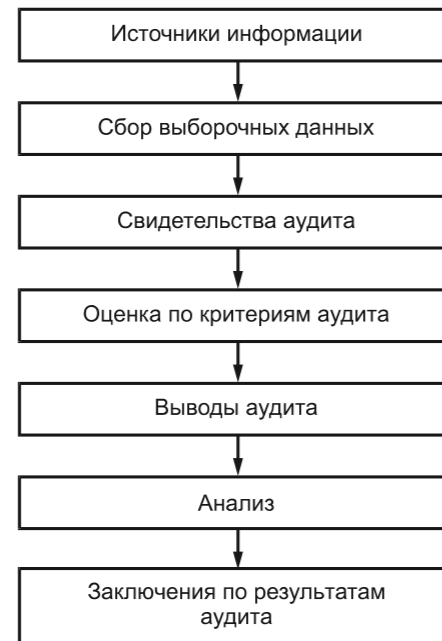
Рисунок 3 — Блок-схема процесса, начиная от сбора информации до получения заключений по результатам аудита